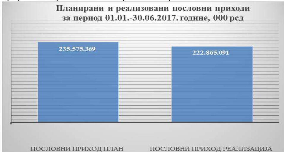
Графикон 1. Приказ пословних прихода за период 01.01.-30.06.2017. године