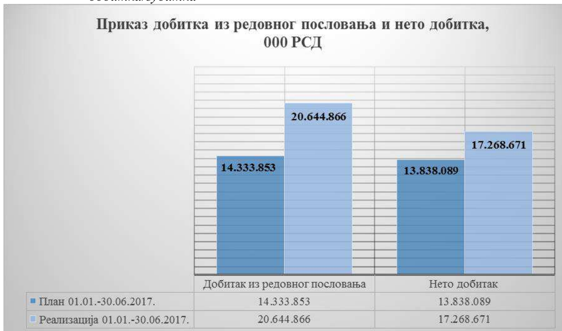
Графикон 5. Приказ пословног добитка/губитка из редовног пословања и нето добитка/губитка