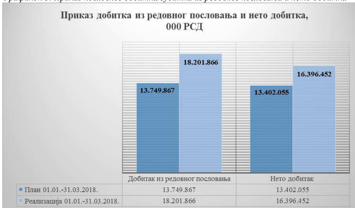
Графикон 5. Приказ пословног добитка/губитка из редовног пословања и нето добитка

За период 1. јануар – 31. март 2018. године планирано је остварење нето добитка у укупном износу од 13.402.055.000 динара и реализован је нето добитак у укупном износу од 16.396.452.000 динара. Реализовани нето добитак је за 22% већи од планираног.